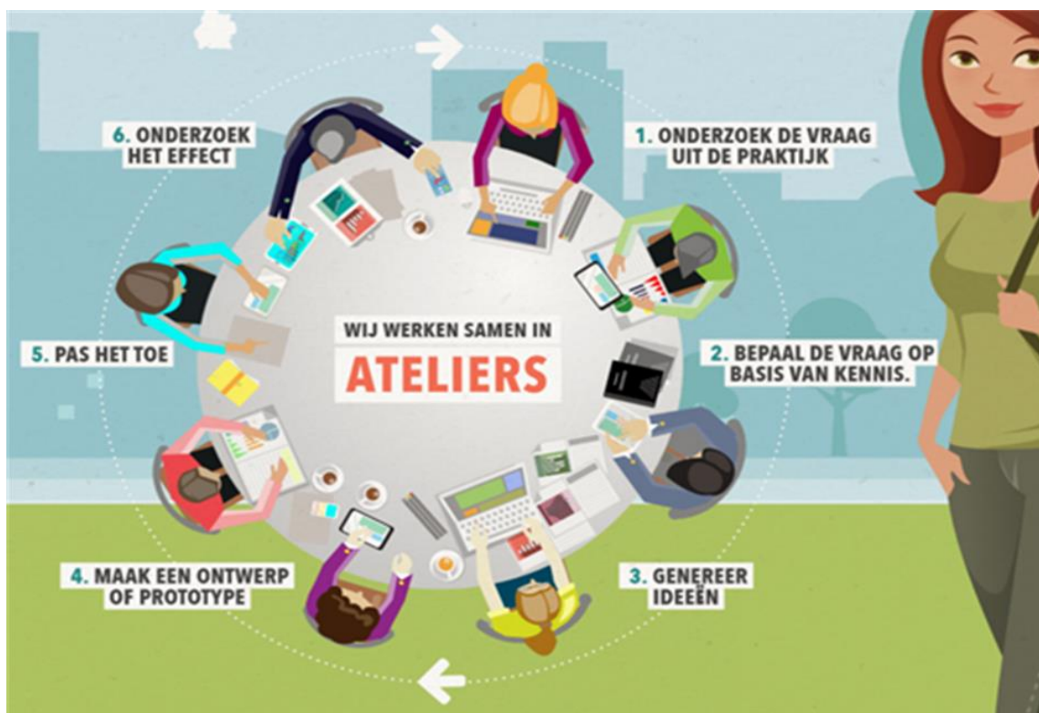
Figuur 2. Basismodel voor het werken in ateliers; een wezenlijk kenmerk van DBE.

Uit Samen opleiden, Beleid ten aanzien van samen opleiden van studenten van de Academie vo & mbo tot startbekwame leraar (en verder), 2019, p.7.